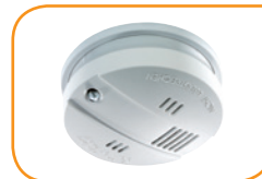
Rauchwarnmelder K-SD4 FlammEXprofi