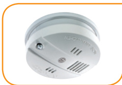
Thermomelder K-TM 3 FlammEXprofi